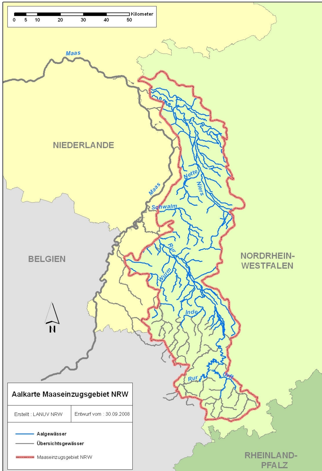
Abbildung 1: Karte der Aal-Habitate der Aalbewirtschaftungseinheit Maas